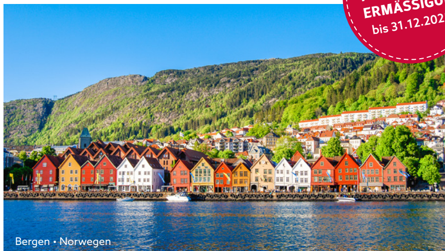
Bergen • Norwegen

mit Reisebegleitung und Zugtransfer ab/bis Rosenheim