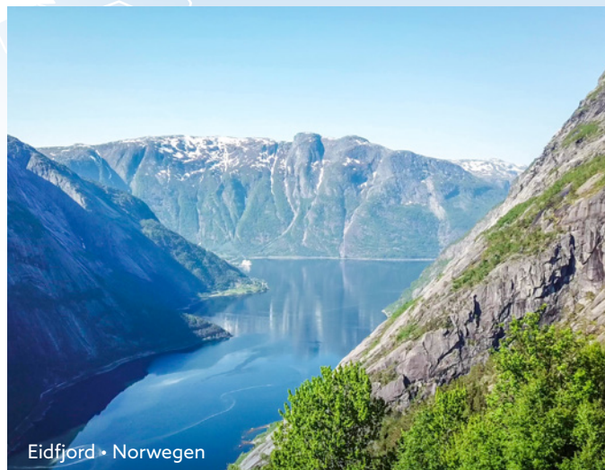
Eidfjord • Norwegen