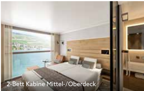
2-Bett Kabine Mittel-/Oberdeck