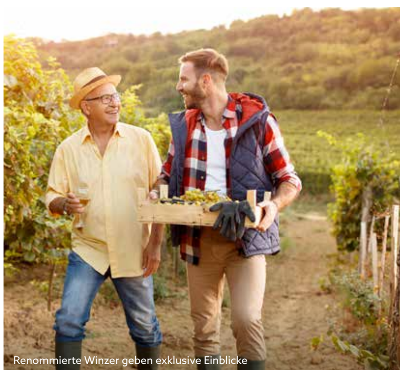
Renommierte Winzer geben exklusive Einblicke

*Mit 200€ Ultra-Frühbucher-Ermäßigung bei Buchung bis 17.03.2025.