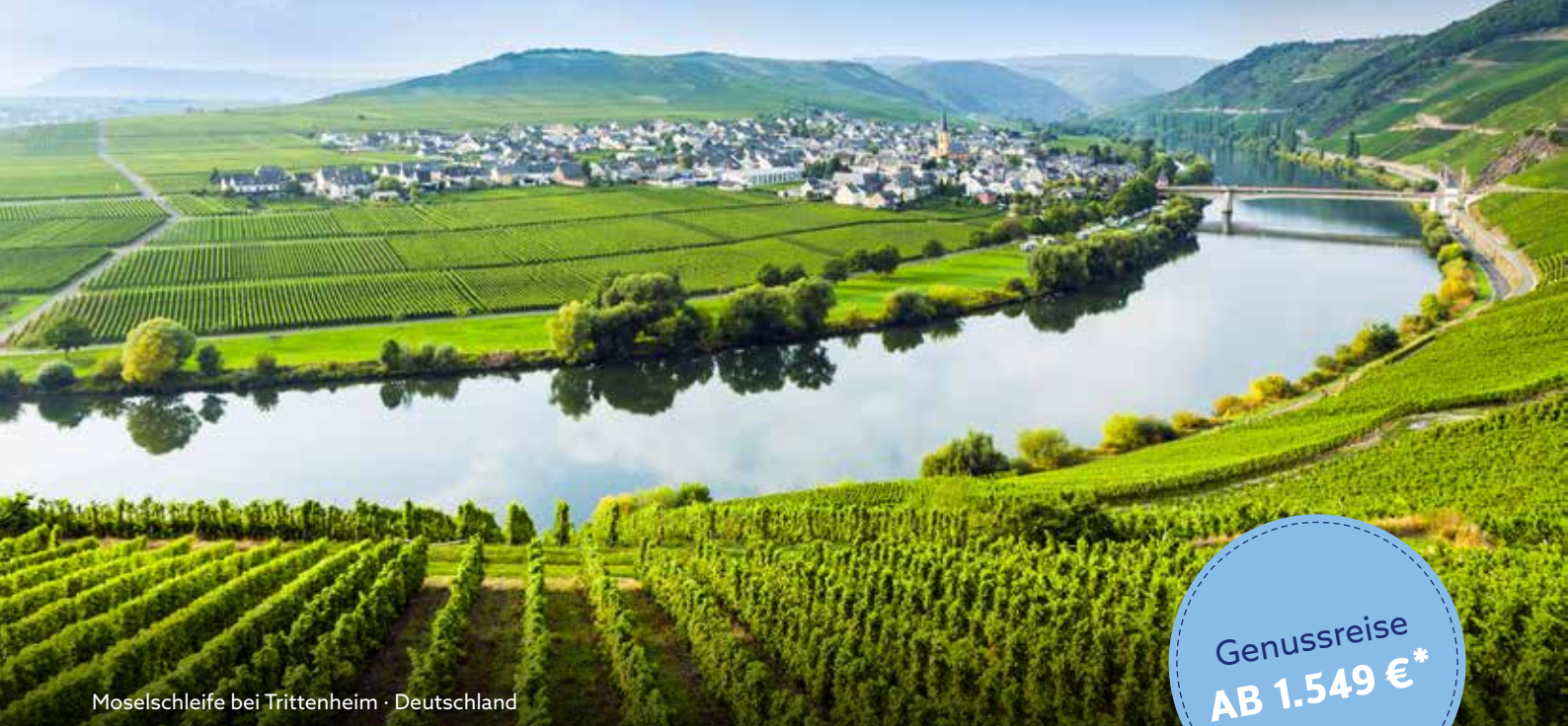
Moselschleife bei Trittenheim · Deutschland