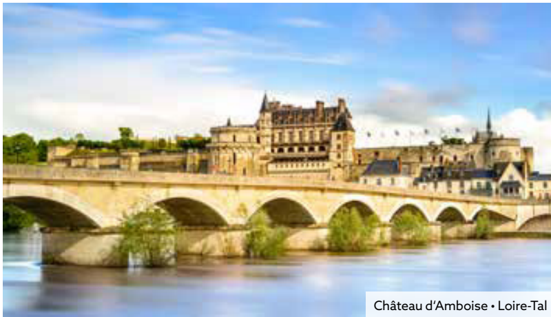
Château d'Amboise • Loire-Tal