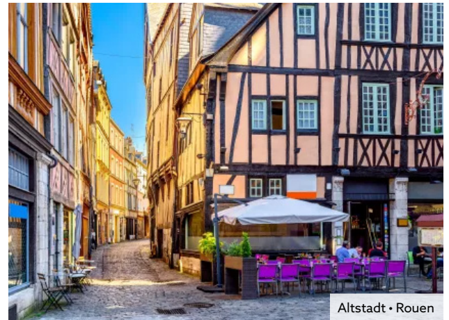
Altstadt • Rouen